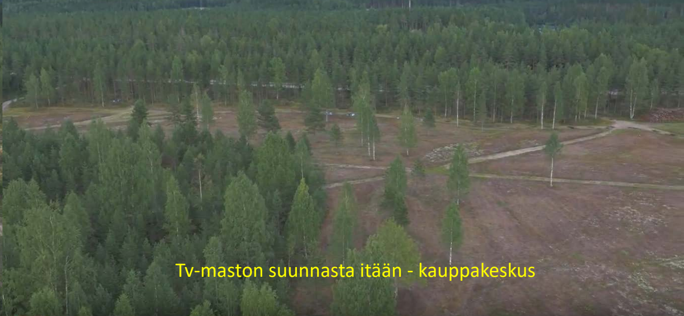
Tv-maston suunnasta itään - kauppakeskus